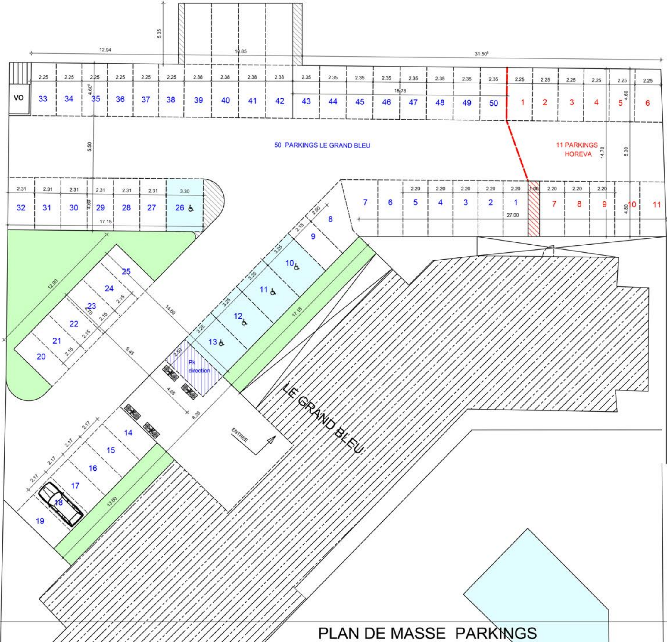
PLAN DE MASSE PARKINGS